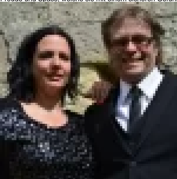
image not found or type unknown | image not found or type unknown | image not found or type unknown

Freude und Spass, welche sie mit einem sicheren Gefühl für ihr Publikum und dem gewünschten Musikmix weitergeben. Eine vielseitige Besetzung, die auf alle Event-Anlässe abgestimmt ist. Fab2 kann unter einfachen Voraussetzungen, ohne grosse Bühne und ohne grosse Lautsprecher auskommen.